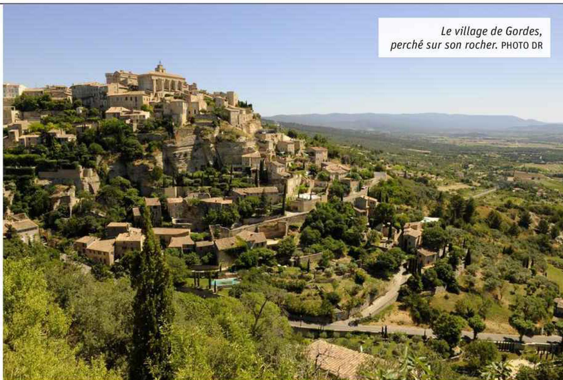
Le village de Gordes, perché sur son rocher.