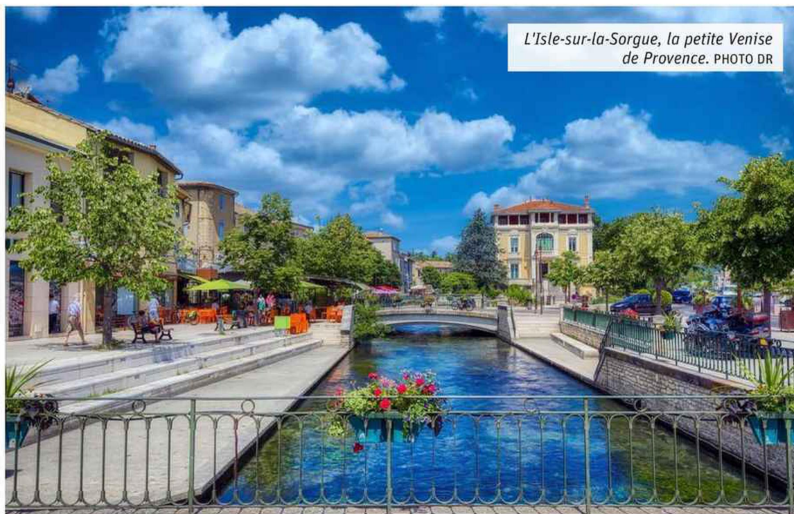
L'Isle-sur-la-Sorgue, la petite Venise de Provence.