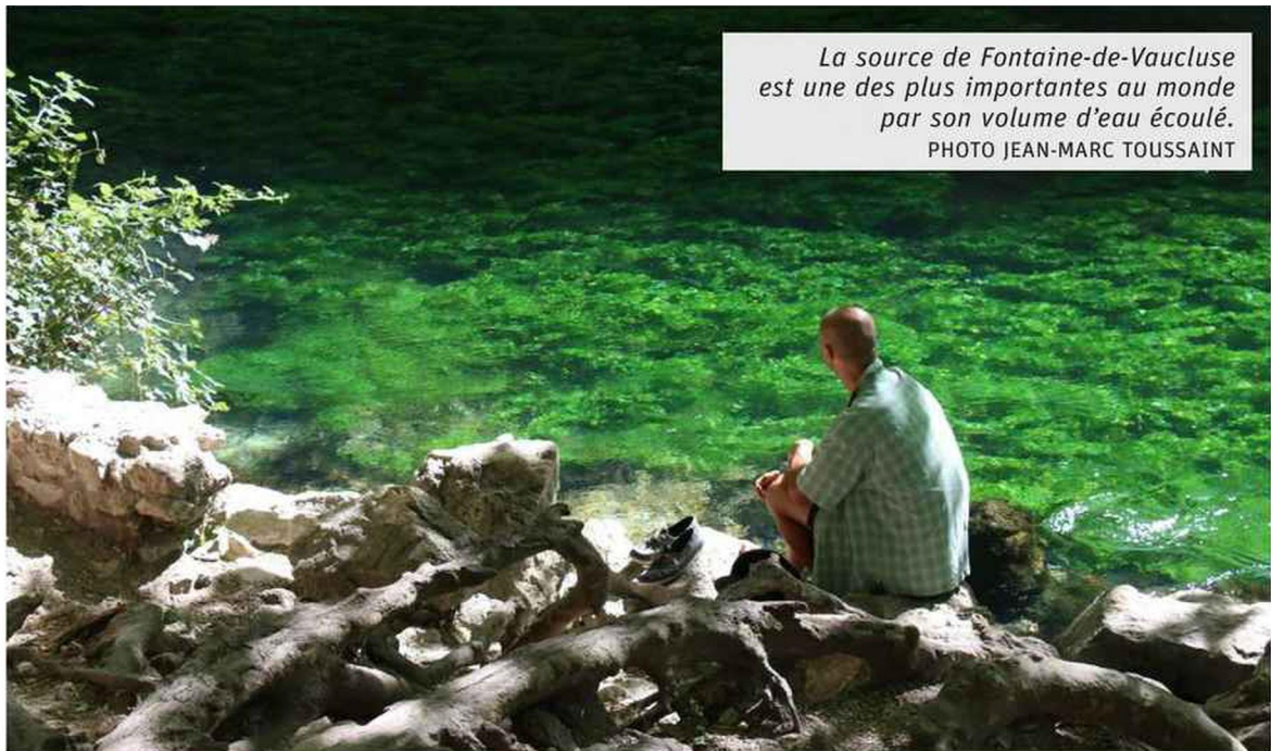
La source de Fontaine-de-Vaucluse est une des plus importantes au monde par son volume d'eau écoulé.