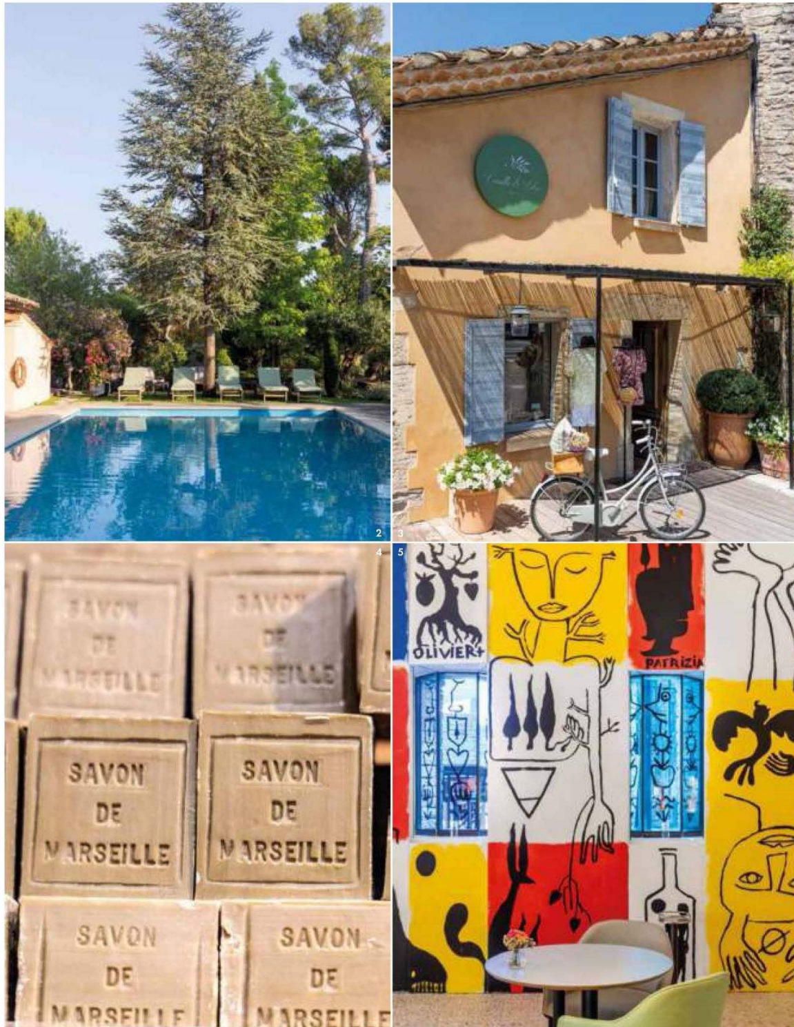
1. Ventana en el pueblo medieval Oppède-le-Vieux, en la región de Luberon. 2. La piscina del hotel Le Pignonnet, en Aix-en-Provence. 3. Tienda Vanille & Lilas, dentro del hotel La Bastide, en el pueblo de Gordes. 4. El tradicional jabón de Marsella, con el aceite de oliva como ingrediente principal. 5. Detalle del mural homenaje a Castelbajac en el restaurante La Loggia del hotel Domain des Andéols, en Saint-Saturnin-lès-Apt.