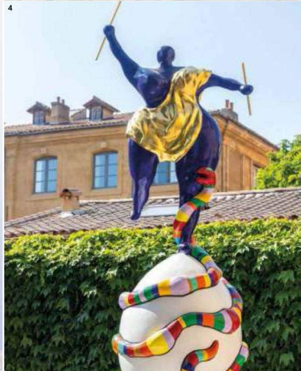
1. 'Bouquets' de lavanda Terre Ugo (terreugo.com). 2. La antigua panadería de Lacoste alberga hoy una biblioteca. 3. Detalle de la recepción del hotel Villa La Coste, en el Château La Coste. 4. 'Le Monde', una de las 'nanas' de la artista Niki de Saint Phalle, que da la bienvenida a su exposición en el Centro de Arte Caumont, en Aix-en-Provence. 5. Antigua fábrica de zapatos en L'Isle-sur-la-Sorgue. 6. Piscina del hotel Domaine des Andéols (andeols.com).