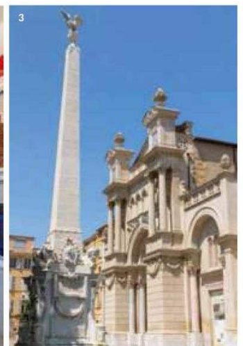
1. Casas de piedra en Bonnieux con su antigua iglesia al fondo. 2. La tienda en el Centro de arte Tadao Ando, en Château La Coste. 3. El obelisco frente a la iglesia de la Madeleine en el centro de Aix-en-Provence.